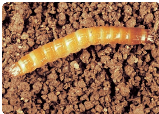
Gusano alambre Medonia deromecoides