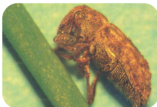
Gorgojo argentino Listronotus bonariensis