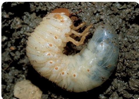
Gusano blanco Hylamorpha elegans